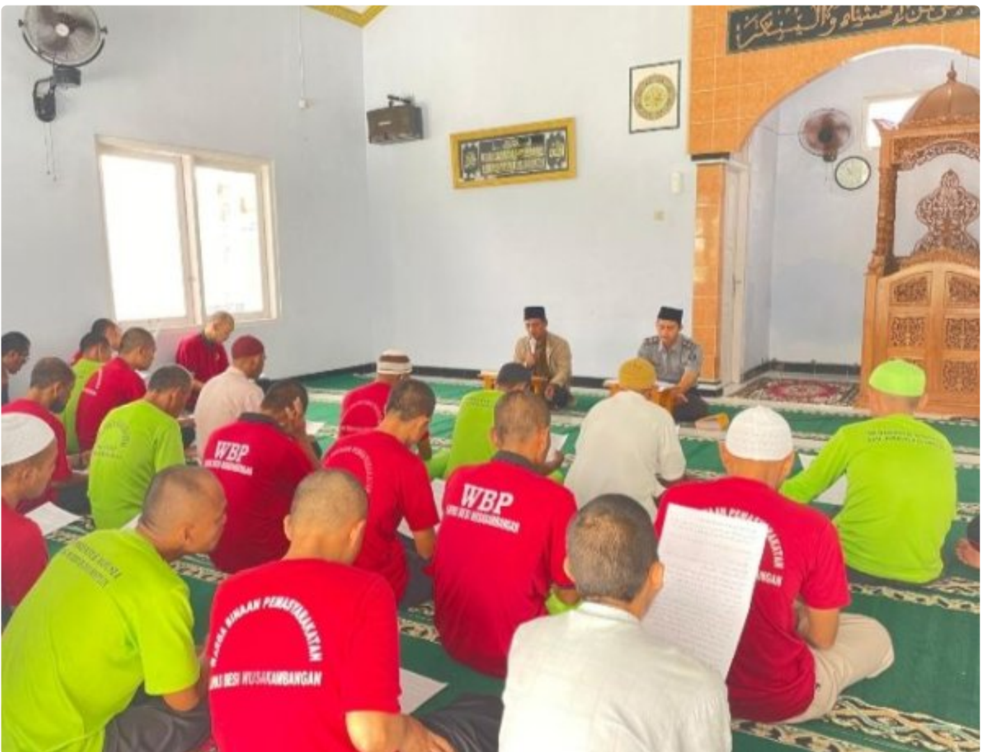
Warga Binaan Lapas Besi Giat Rutin Pengajian Bersama Penyuluh Kemenag Cilacap

CILACAP - Lembaga Pemasyarakatan (Lapas) Kelas IIA Besi Pulau Nusakambangan menyelenggarakan kegiatan pembinaan kepribadian dalam rangka memperdalam ilmu agama Warga Binaan Pemasyarakatan (WBP)