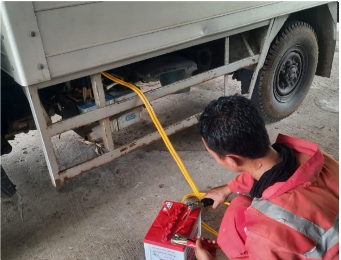
Petugas Staf Umum Lakukan Pengecekan