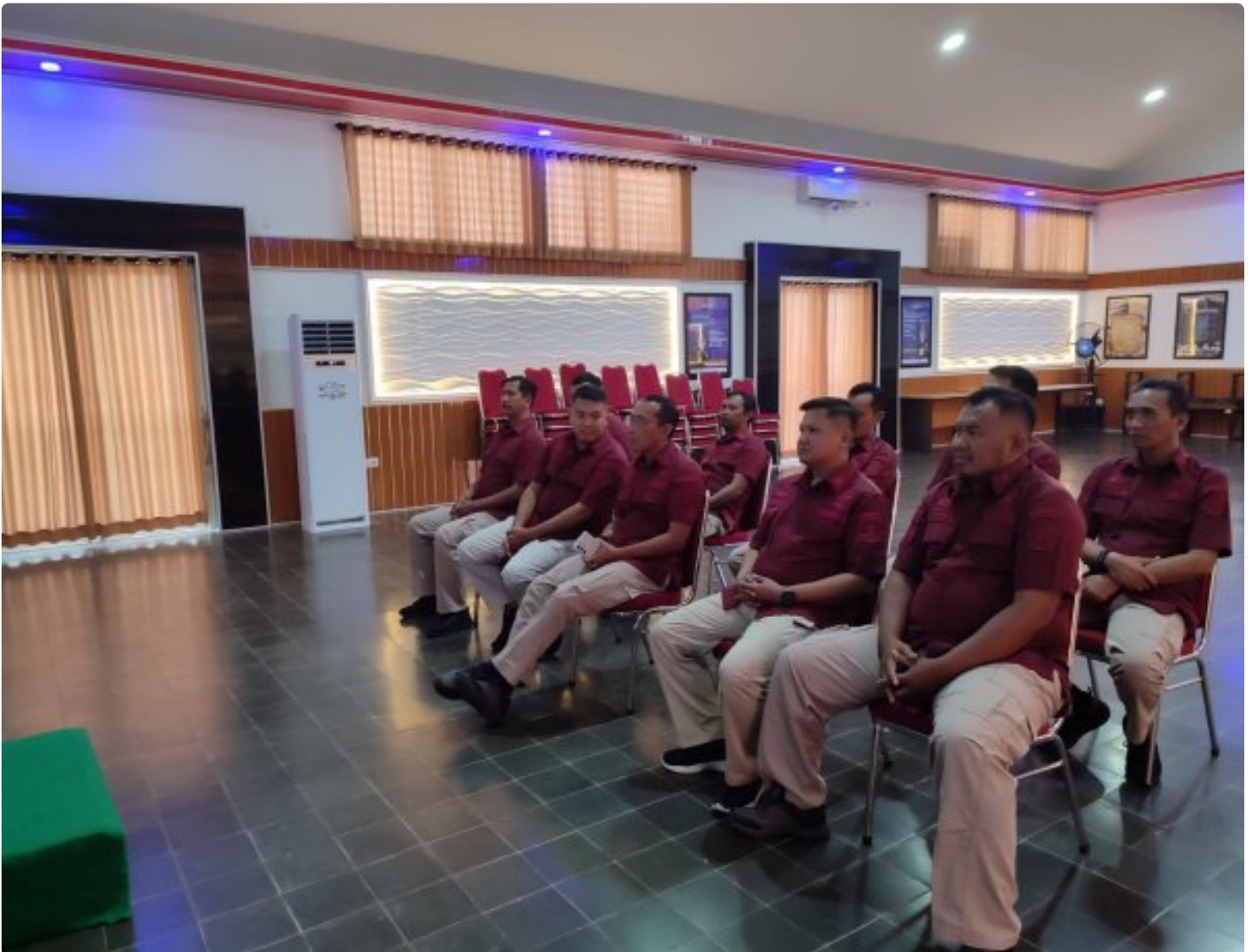
Bangun Personal Branding ASN, Lapas Besi Hadiri Webinar Series 6

CILACAP – Petugas Lapas Kelas IIA Besi Nusakambangan menghadiri kegiatan Webinar Series 6 yang diselenggarakan oleh Badan Pengembangan Sumber Daya Hukum (BPSDM) dan HAM bertempat di Aula Wijaya Kusuma, Kamis (24/10/2024).